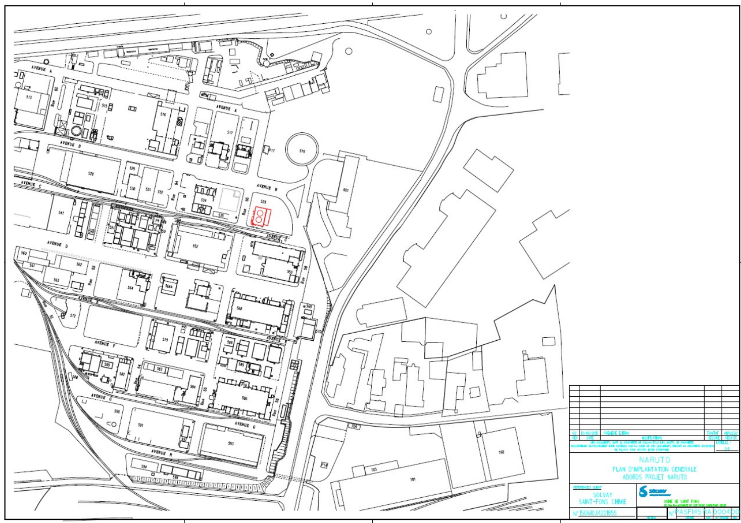
Stockage des produits inflammables en rouge